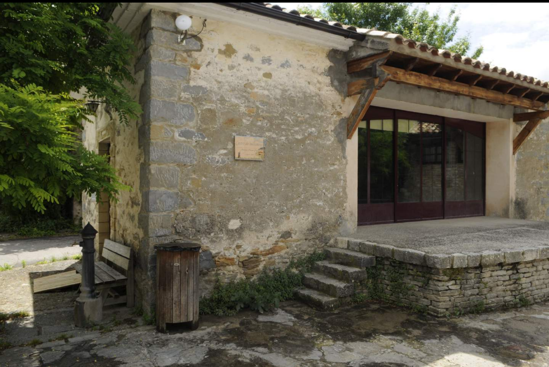
Punto de Encuentro con el guía para los abrigos de Barfaluy-Lecina Superior.