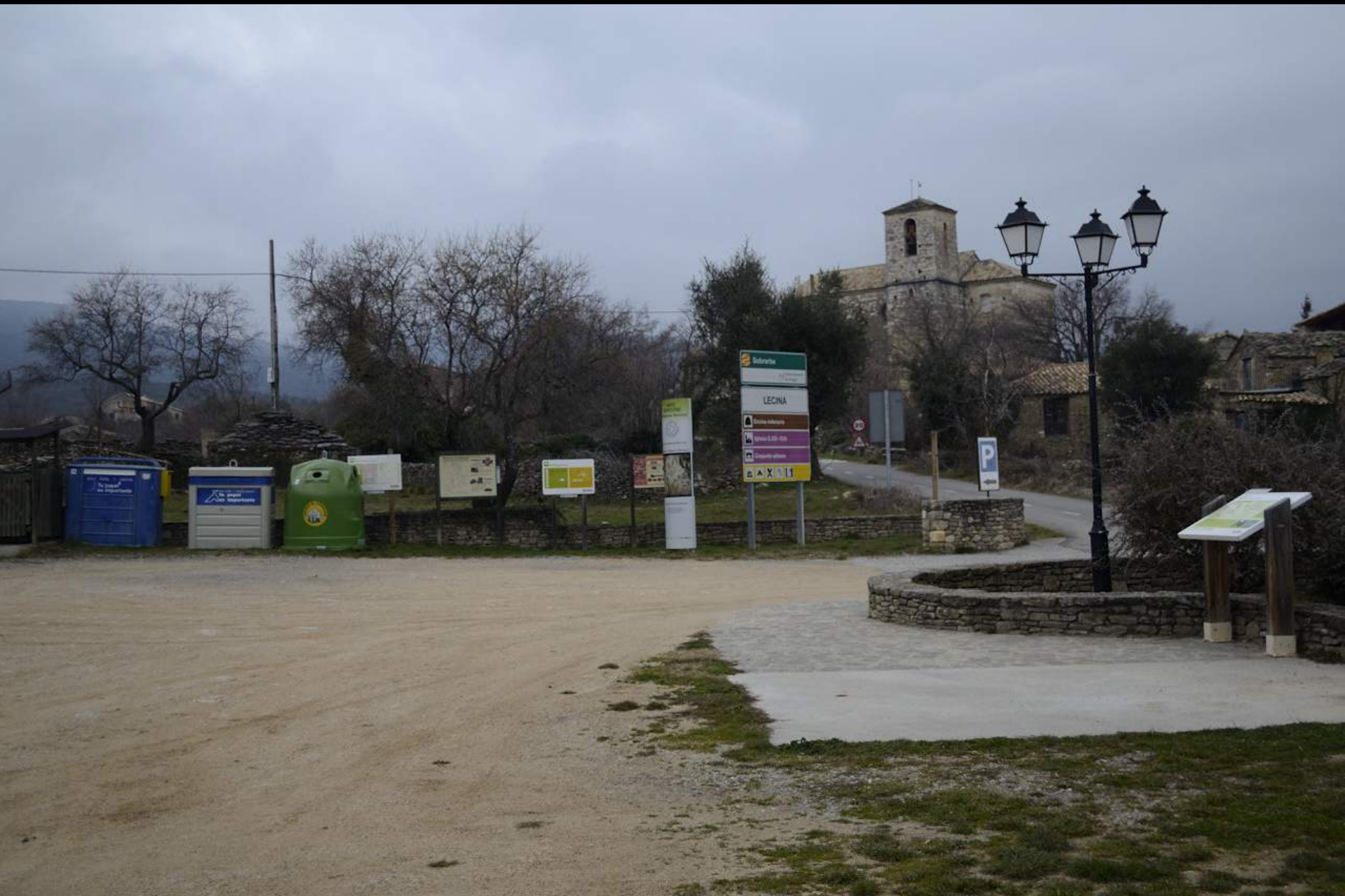
Parqing en la localidad de Lecina.