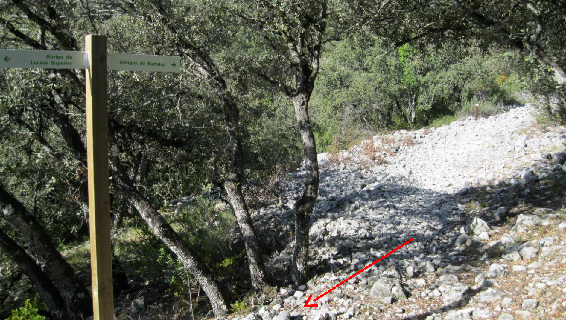
Desvío al abrigo de Lecina Superior .